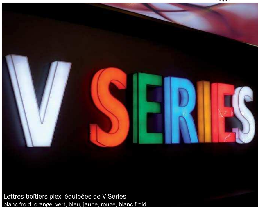
Lettres boîtiers plexi équipées de V-Series blanc froid, orange, vert, bleu, jaune, rouge, blanc froid.