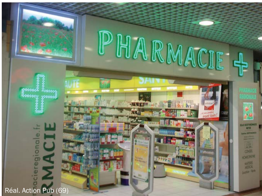
Réal. Action Pub (69)